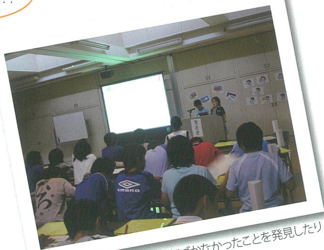
調べたことを紹介しあって、気づかなかったことを発見したり、共有したりすることができました。

ここでは、モデルプログラムをもとに行った取り組みの様子を掲載しています。実際に取り組んだ学校の授業の様子や先生の声を事例集で紹介しています。併せてご覧ください。