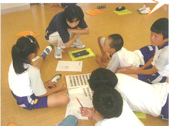
集めた資料や体験したことをもとに、パンフレットづくりや、おすすめポイントの企画を立てました。地域の魅力が伝わるように工夫しました。