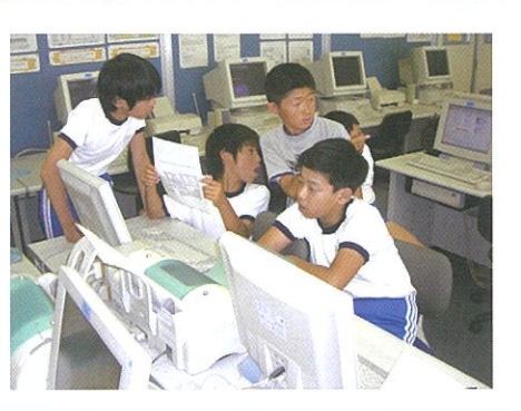
パソコンを使って、発表用の資料づくりをしました。