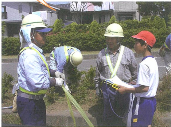
作業中の地域の方にインタビューもできました。