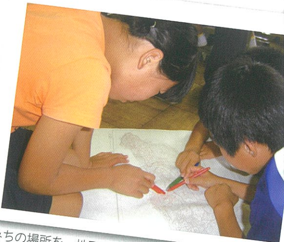
みちの場所を、地図で探しました。