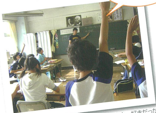
自分たちが6年間通った道で、思い出に残ること、好きだった場所を話し合いました。身近な場所なので、たくさんの意見が出てきました。