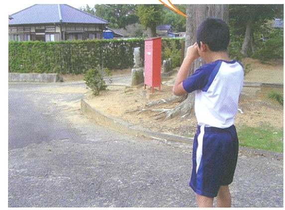
登下校の道で、思い出に残るところを撮影しました。