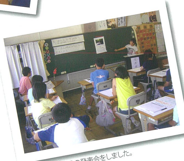
自分が見つけた作品の発表会をしました。

ここでは、モデルプログラムをもとに行った取り組みの様子を掲載しています。実際に取り組んだ学校の授業の様子や先生の声を事例集で紹介しています。併せてご覧ください。