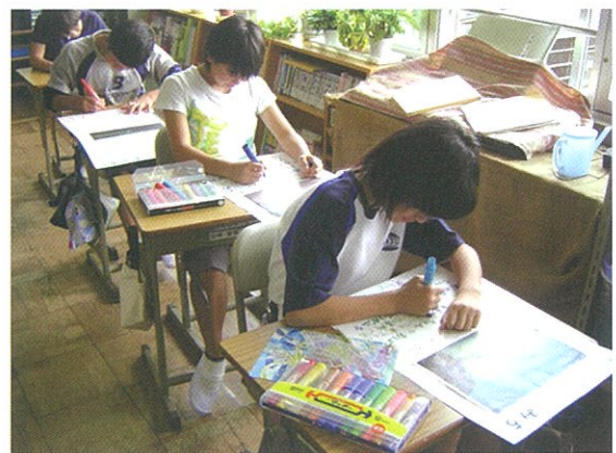
撮ってきた写真にタイトルとストーリーをつけて、まとめました。