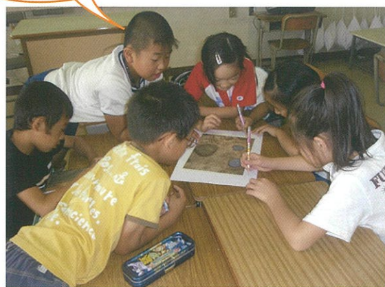
グループで作品作りをしました。このカオがどんなことをしゃべっているのか考えながら、吹き出しもつけました。