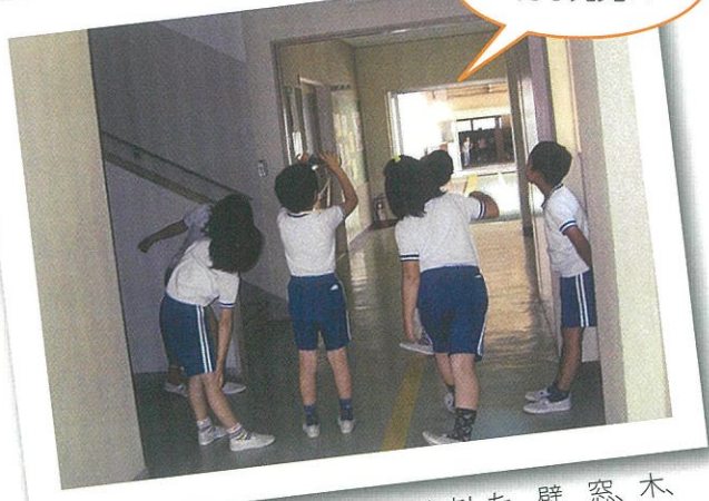
校内に隠れているカオを探しに行きました。壁、窓、木、遊具などに近づいたり離れたり、角度を変えたりして、目、鼻、口を見つけ出しました。