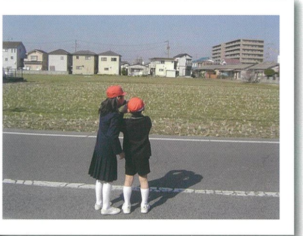
まちの中に出ってみました。道路の脇に、向こうの住宅地。カオはまちのいろいろなところで見つけれそうです。