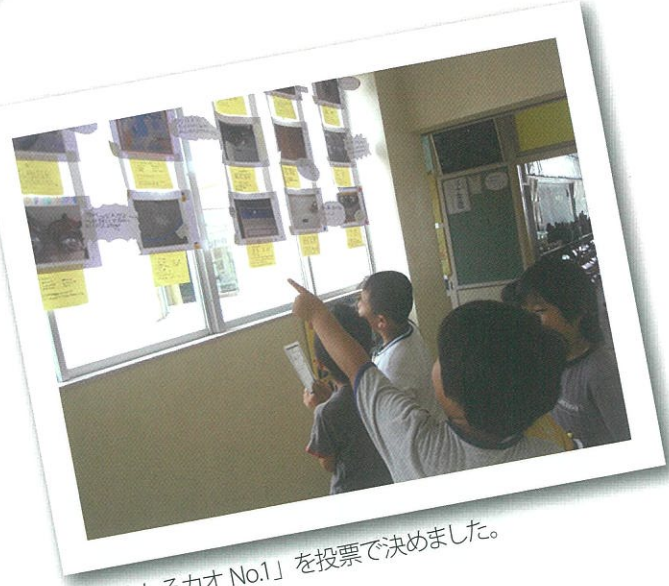
「おもしろカオ No.1」を投票で決めました。

ここでは、モデルプログラムをもとに行った取り組みの様子を掲載しています。実際に取り組んだ学校の授業の様子や先生の声を事例集で紹介しています。併せてご覧ください。