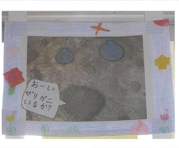
きれいにレイアウトをして、作品の完成です。『おーい ザリガニいるか?』