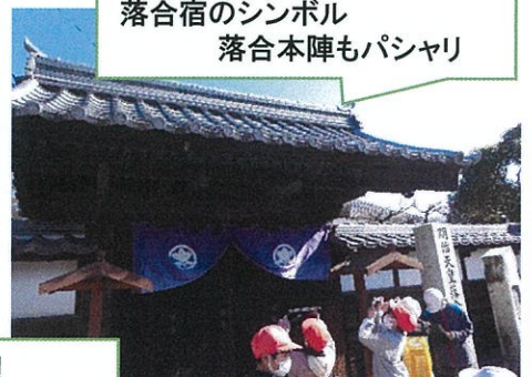
落合宿のシンボル 落合本陣もパシャリ