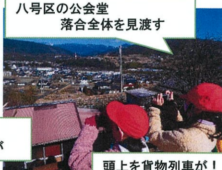
八号区の公会堂 落合全体を見渡す