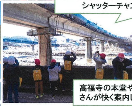
頭上を貨物列車が！！ シャッターチャンス