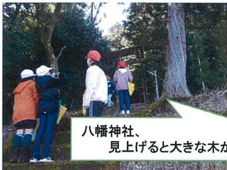
八幡神社、 見上げると大きな木が