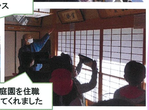
高福寺の本堂や庭園を住職 さんが快く案内してくれました