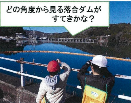
どの角度から見る落合ダムが すてきかな？