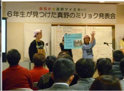
まちのミリオク発表会